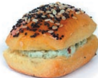
Bun crème de roquefort

Sélection en fonction du marché par exemple : tarama, mousse de foie, crème de roquefort, crème de thon etc.