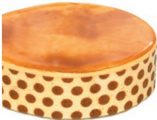
Le nouveau Kara « pop'art »